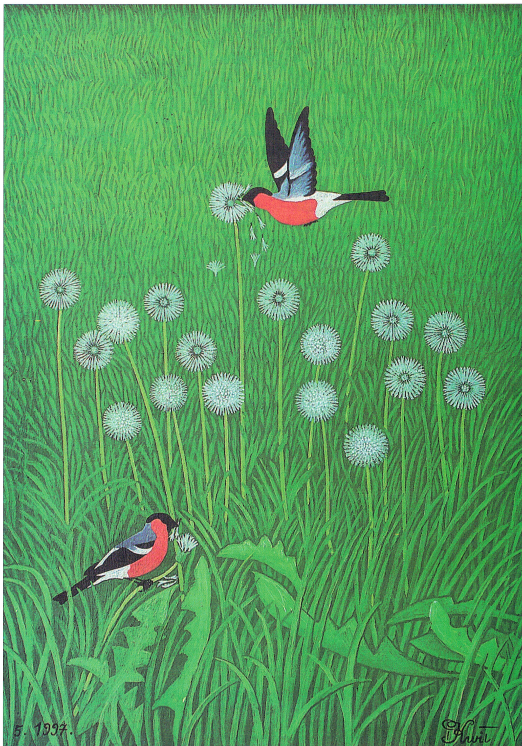
Na swych obrazach Piotr Kwit kreuje rajski świat - doskonały, pełen ptaków, piękna, harmonii i spokoju. Powyżej: Gile na mniszkach , maj 1997 (45 x 33 cm), olej, pilśni. Na stronie obok: Tęcza , sierpień 1999 (62 x 35 cm), olej, pilśni.