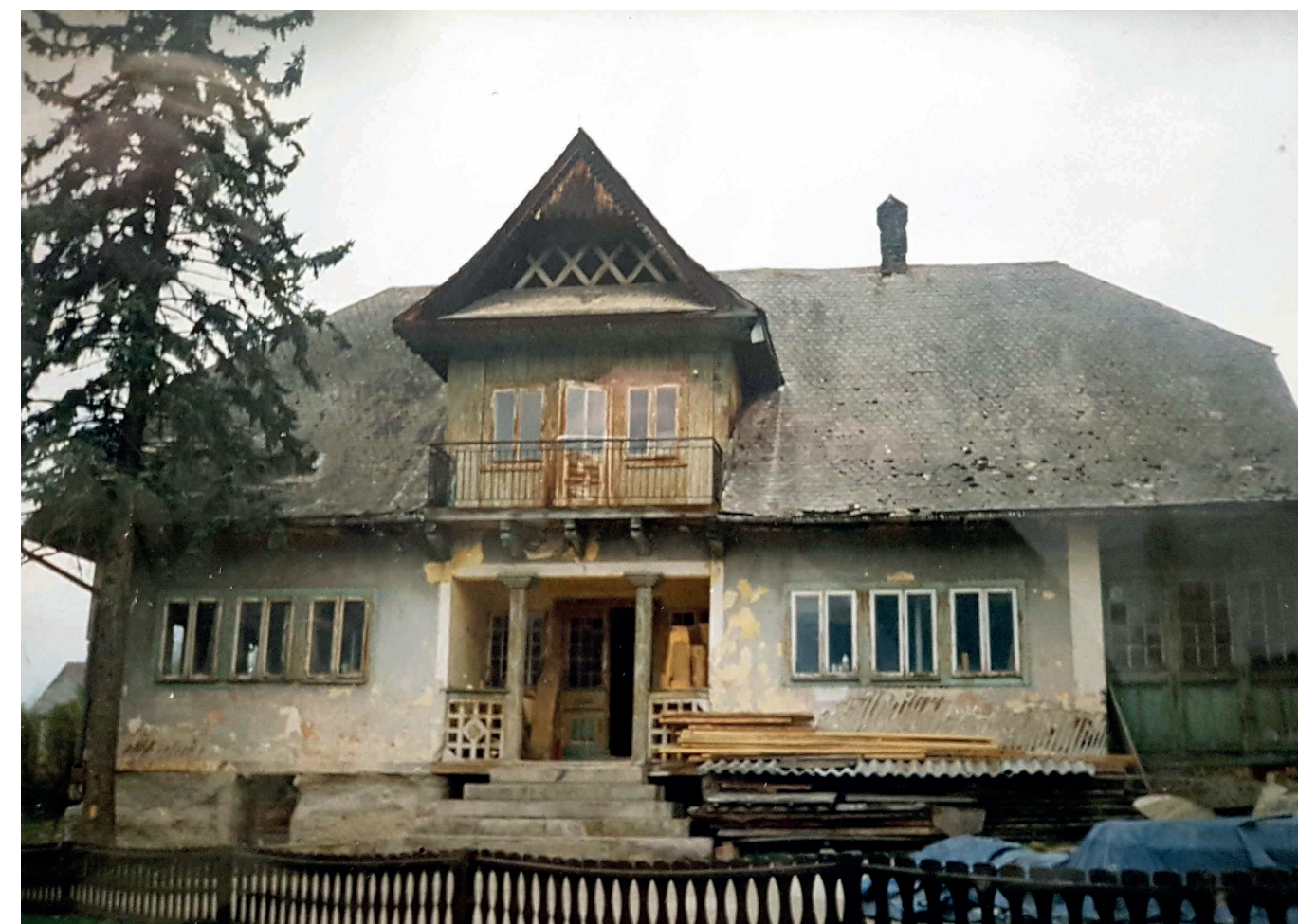
Dom w Dobrej, 2000 r.