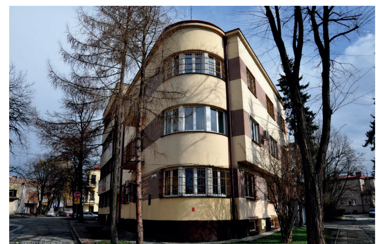
Budynek Gestapo w Nowym Sączu współcześnie