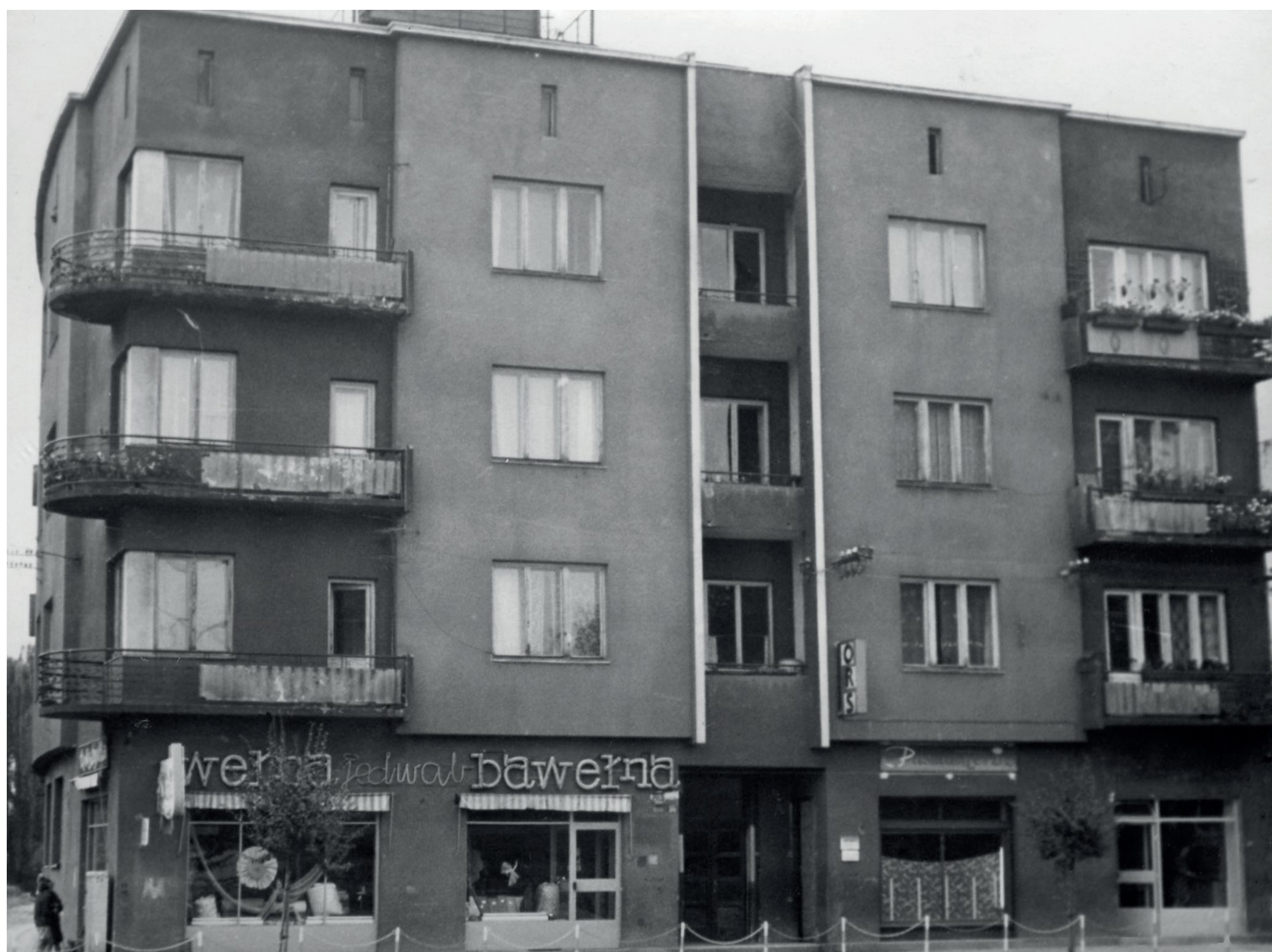
Budynek, w którym mieścił się bar „Hanka”