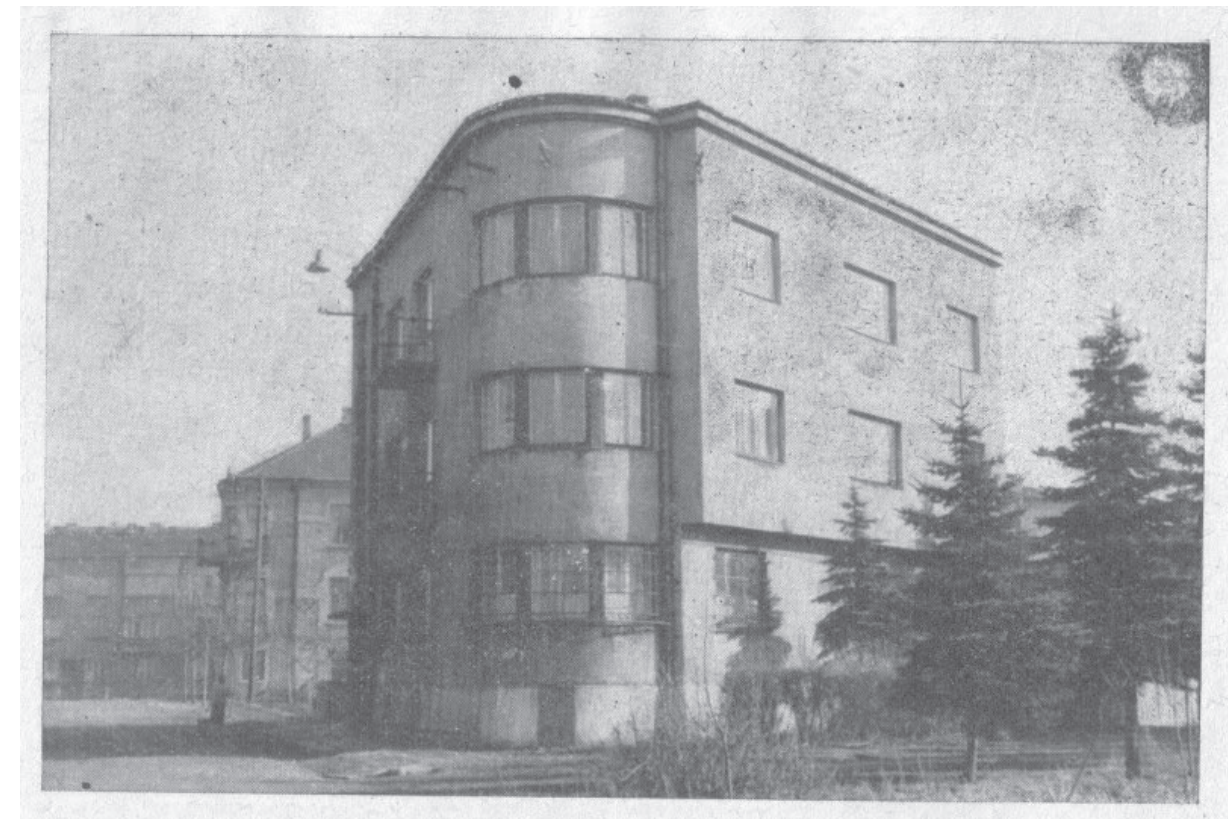
Budynek Gestapo w Nowym Sączu przed II wojną światową