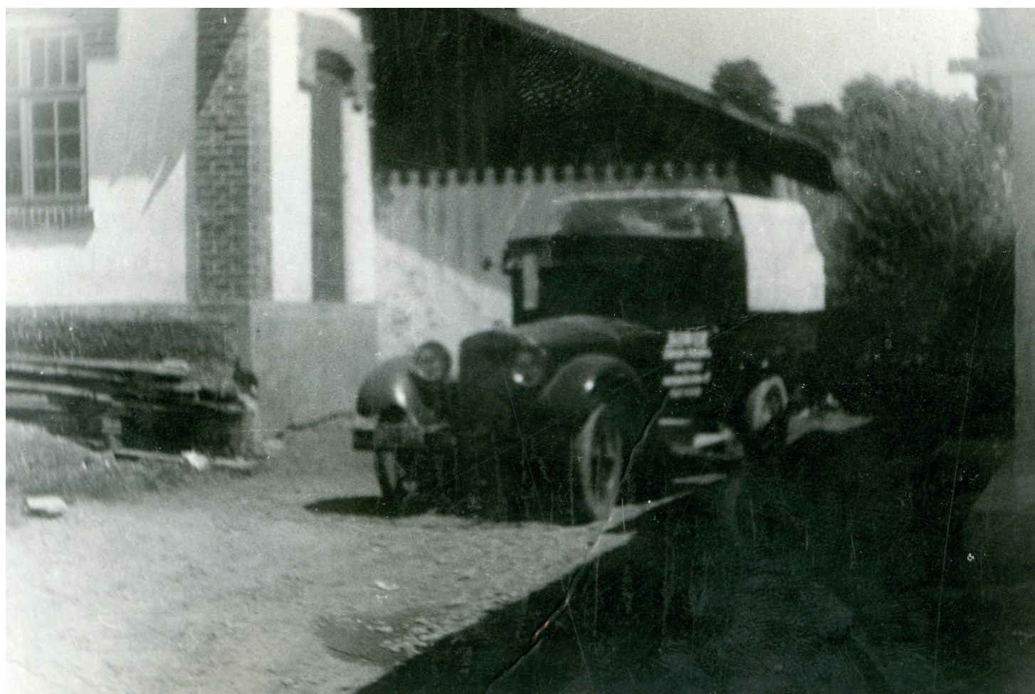
Dobra 1938 r.